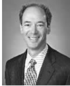
北美信托银行首席经济学家 卡尔·坦南鲍姆