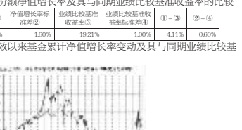
净值收益率变动的比较

展望2季度,我们仍谨慎乐观。A股整体估值水平虽然有所修复,但仍处在合理区间,各行业龙头估值水平与其他市场比较中仍具备一定吸引力,在MSCI逐步提高A股权重的过程中存在进一步提升空间。1季度以来的经济数据有部分好转迹象,减税降费等积极财政政策效果也将逐步体现,宏观政策预期有所好转,消费与顺周期行业基本面对估值存在修复空间。科创板稳步推进,彰显国家对支持创新型企业发展、资本市场改革的决心,我们也将继续关注5G、人工智能、高端装备、生物医药等战略性新兴产业。