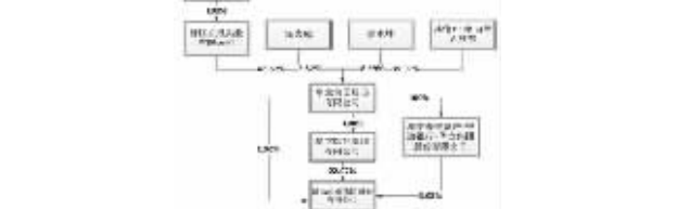
图3: 公司与实际控制人之间的产权及控制关系的方框图