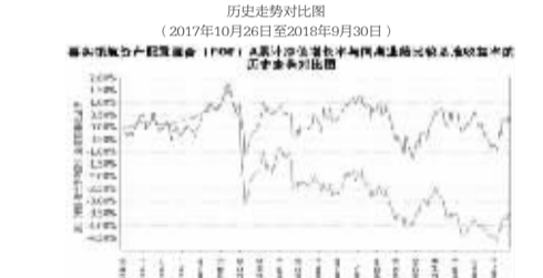
图：嘉实领航资产配置混合(FOF)基金业绩累计净值增长率与同期业绩比较基准收益率的历史走势图对比图 (2017年10月26日至2018年9月30日)

变动图 图：嘉实领航资产配置混合(FOF)A基金累计净值增长率与同期业绩比较基准收益率的历史走势图对比图 (2017年10月26日至2018年9月30日)