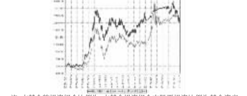
注:本基金的投资组合比例为:本基金投资组合中股票投资比例为基金资产

3.2 基金净值表现 3.2.1 本报告期基金份额净值增长率及其与同期业绩比较基准收益率的比较