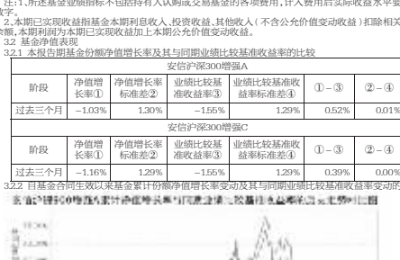
注1：本基金合同生效日为2016年10月26日，Q2、Q3基金合同生效前，基金经理人应当自基金合同生效之日...