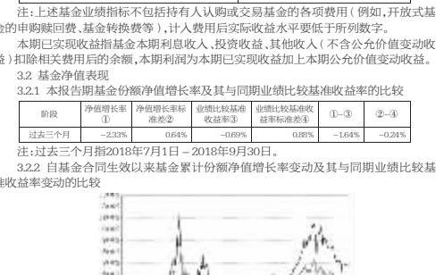
注:1.截止日期为2018年9月30日。 2.本基金于2014年4月30日由原富国天利增长债券投资基金转型而成,建仓期6个月,从2014年4月30日至2014年10月29日,建仓期结束时资产配置比例符合基金合同约定。