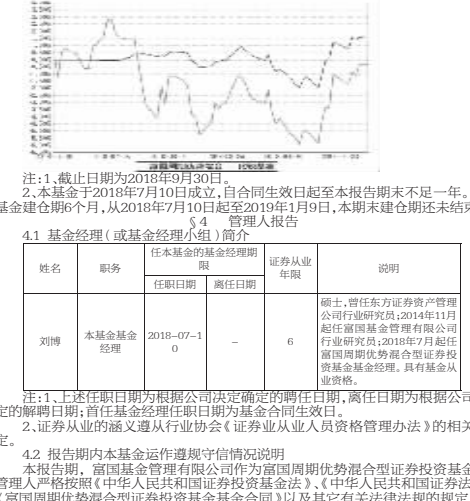
注：1.截止日期为2018年9月30日。 2.本基金于2018年7月10日生效，自合同生效日起至本报告期末不足一年。 本基金建仓日期：从2018年7月10日起至2018年9月30日，本期未建仓期间还未结束。

4.1 基金经理（或基金经理小组）简介 姓名：王冠 职务：基金经理 任职日期：2018年07月10日 说明：王冠先生于2018年7月10日起担任本基金的基金经理职务。