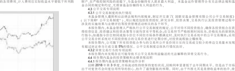
注:1.本基金业绩比较基准为中证全债指数收益率*90%+银行活期存款利率*10%。 注:2.本基金基金合同于2014年7月29日生效,本基金建仓期为基金合同生效之日起6个月,建仓期结束后本基金资产配置比例符合合同约定。

基金管理人:国联安基金管理有限公司 基金托管人:中信银行股份有限公司 报告送出日期:二〇一八年十月二十五日 1 重要提示 基金管理人及基金托管人承诺不存在虚假记载、误导性陈述或重大遗漏,并对其内容的真实性、准确性和完整性承担个别及连带责任。