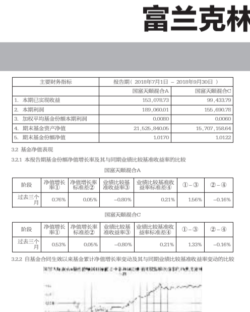
注:本基金的基础合生收益日为2018年10月27日,截止本报告期末,本基金建仓日期尚未结束,建仓后本报告期末建仓结束未满一年,本基金在6个月建仓日期结束,各项投资比例符合基金合同约定。

基金管理人:国海富兰克林基金管理有限公司 基金托管人:中国工商银行股份有限公司 基金合同生效日期:2018年10月25日 主要财务指标:本报告期末总资产 1,142,874,236.14元