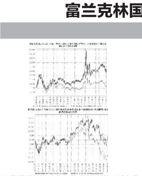
注:本基金的基础合生收益日为2007年2月26日,本基金1类份额的资产净值日为2018年4月7日,本基金在9个建仓日期结束,各项投资比例符合基金合同约定。

基金管理人:国海富兰克林基金管理有限公司 基金托管人:中国工商银行股份有限公司 基金合同生效日期:2018年10月25日 主要财务指标:本报告期末总资产 1,142,874,236.14元