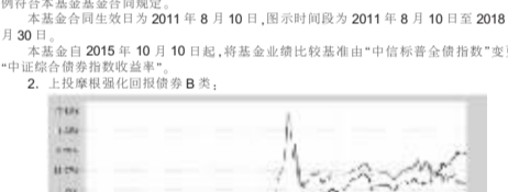
注:本基金合同生效日为2011年8月10日,图示时段为2011年8月10日至2018年9月30日

注:本报告期内基金管理人、投资决策、其他收入(不含公允价值变动收益)扣除相关费用后的余额,本期利润为本期公允价值变动收益