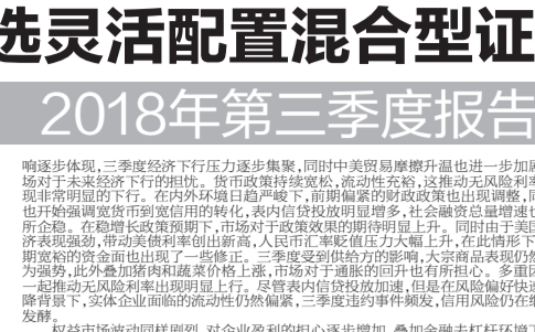
易方达瑞祥基金基金经理