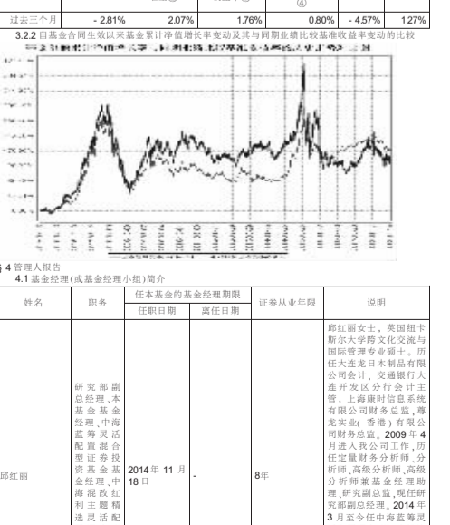
图 1:本基金自 2016 年 7 月 1 日至 2018 年 9 月 30 日,上述基金指标与业绩比较基准的对比

3.2 自基金合同生效以来基金累计净值增长率变动及其与同期业绩比较基准收益率变动的比较