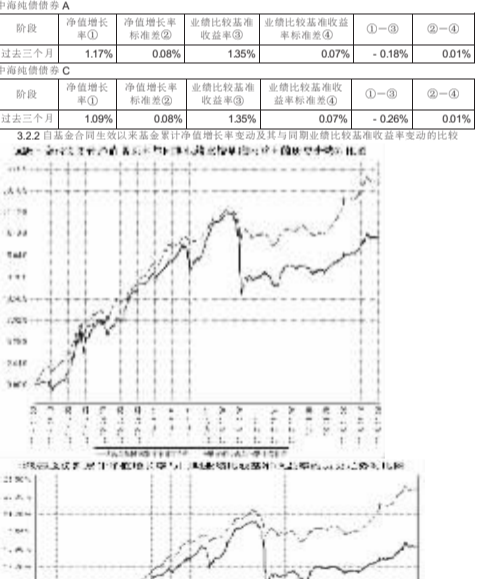
图 1:本基金自 2016 年 7 月 1 日至 2018 年 9 月 30 日,上述基金指标与业绩比较基准的对比

3.2 自基金合同生效以来基金累计净值增长率变动及其与同期业绩比较基准收益率变动的比较