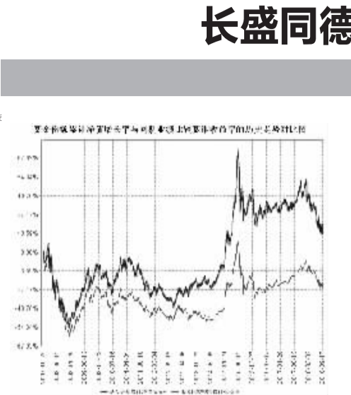
注:本基金由同德证券投资基金转型而来,转型日为2007年10月25日。

2018年9月30日 基金管理人:长盛基金管理有限公司 基金托管人:中国银行银行股份有限公司 报告送出日期:2018年10月24日