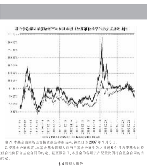
注:1,本基金由同德证券投资基金转型而来,转型日为2007年11月5日。 2,本基金合同规定,本基金基金管理人应当自基金合同生效之日起6个月内使基金的资产配置比例符合基金合同约定的。截至报告日,本基金的各项资产配置比例符合基金合同的所有约定。

2018年9月30日 基金管理人:长盛基金管理有限公司 基金托管人:中国银行银行股份有限公司 报告送出日期:2018年10月24日