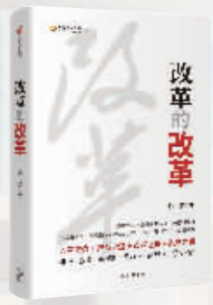
作者：徐忠 出版社：中信出版社 内容简介：

本书围绕“改革的改革”这一主题，从新时代改革的背景和定位（改革之势）出发，明确问题导向、改革路径和基本原则（改革之道），结合战略思维、创新思维、辩证思维、法治思维、底线思维这五大思维方法（改革之法），提出切实可行的政策建言（改革之策）。