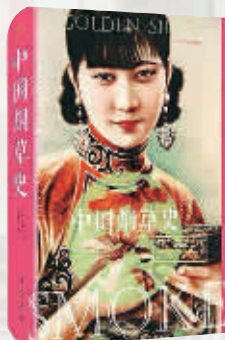
作者：【美】班凯乐 出版社：北京大学出版社 内容简介：

本书讲述了美洲的烟草从16世纪传入中国，开始在中国商业种植以来的传播历程。从水烟、烟枪、鼻烟、手卷烟到现代机制卷烟工业，是一段非常迷人的大众消费和全球经济发展的历史。本书荣获美国历史学会2011年度费正清东亚研究奖。