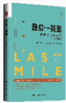
作者：【加】迪利普·索曼 出版社：中国人民大学出版社 内容简介：

本书涉及社会心理学、行为经济学等领域的内容，运用这些行为科学知识带来的洞察力，可以帮助我们充分了解消费者的决策过程，并将其应用于解决各种“最后一英里”问题。