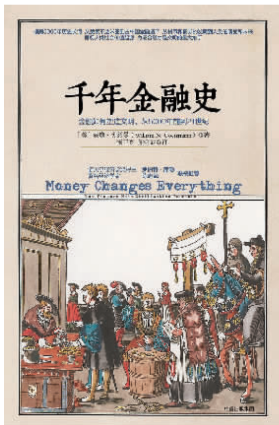
书名：《千年金融史》 作者：【美】威廉·戈兹曼 出版社：中信出版集团

威廉·戈兹曼在本书中，通过对数千年来金融在全世界范围内扮演的重要角色的探索，详细阐述了货币、债券、银行、企业等令人惊奇的金融工具和金融体系如何推动了城市中心的扩张，并促进了文明的繁荣。戈兹曼还向我们展示了在人类的历史进程中，诸如股票市场、信用额