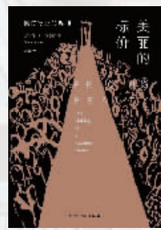
作者：【美】阿什利·米尔斯 出版社：华东师范大学出版社 内容简介：

本书对众多追梦者的生活进行深思熟虑分析、精彩的故事讲述，呈现所有身在其中所要遭遇的惊奇与残酷。本书是一张邀请函，让读者走到幕后背后来探索模特制造的过程。适合关注文化产业、创意经济、身体资本与权力政治、性别与阶层研究的人群。