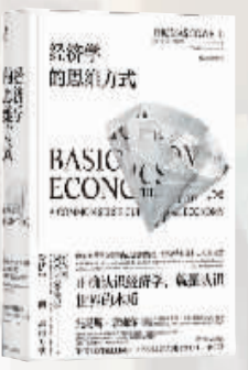
作者：【美】托马斯·索维尔 出版社：四川人民出版社 内容简介：

通过本书，我们将会了解价格、投资和国际贸易等方面方面的知识，也会对媒体、政治家、公知的言论保持警醒和怀疑，不再不加批判地用“穷人”和“富人”来区分不同的人群。