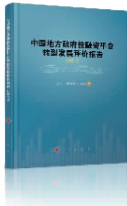
书名:《中国地方政府投融资平台转型发展评价报告》 作者:胡恒松 出版社:人民出版社