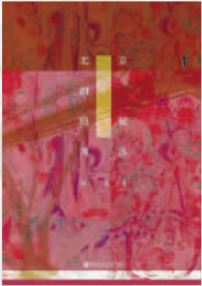
作者:陆波 出版社:社会科学文献出版社 内容简介: 作为生于斯长于斯的北京人,陆波用自己的目光去追寻定慧寺、宣芸馆、蓝靛厂、保福寺、樱桃沟等“角落”的历史足迹,考察那里的文物遗存,讲述那些在历史上留下或深或浅印记的人们故事,试图将大时代与小事件勾连起来。 作者简介: 陆波,执业律师,现为 腾讯·大家”专栏签约作者。