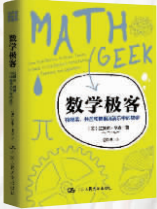
作者:拉斐尔·罗森 出版社:中国人民大学出版社 内容简介: 你梦到过长除法吗,复杂方程的解法会让你莞尔一笑吗,你每年三月会庆祝π日吗?如果是,这本《数学极客》就是为你而生的。有了这本指南,你可以在从未想过的方式探索大自然的同时,更加了解数学的力量和美。从椰菜花到肥皂泡再到地铁线路图,每一页都能让你以大数学家的眼光去认识世界,探索如何将他们发现的定理和方程应用到万事万物中。 作者简介: 拉斐尔·罗森,科学写作者。