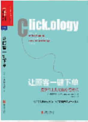
作者:格雷厄姆·琼斯 出版社:北京联合出版公司 内容简介: 知名互联网心理学家格雷厄姆·琼斯在《让顾客一键下单》中将心理学及行为经济学巧妙地结合在一起,揭示了网购背后的心理动机,以及如何利用互联网心理学和零售心理学,来构建零售企业的在线策略。 作者简介: 格雷厄姆·琼斯,著名互联网心理学家,专注于研究互联网对消费者行为的影响。