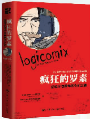
作者:阿波斯托洛斯·佐克西亚季斯 赫里斯托斯·H.帕帕季米特里乌 出版社:中国人民大学出版社 内容简介: 本书取材于声名显赫的哲学家伯特兰·罗素,讲述了他的早年生活以及他对真理满怀激情的追求过程。既是一部历史小说,也是一本逻辑学、数学的导引书,通俗易懂地介绍了数学和逻辑学中的伟大思想。 作者简介: 阿波斯托洛斯·佐克西亚季斯,著名畅销书《佩德罗斯叔叔与哥德巴赫猜想》,这是一部围绕数学展开的迷人小说。 赫里斯托斯·H.帕帕季米特里乌,美国加州大学伯克利分校计算机科学专业教授。