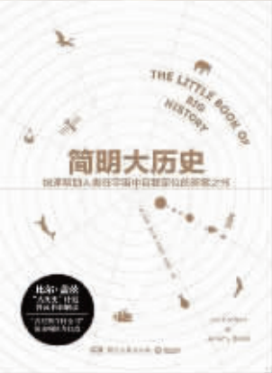
作者:伊恩·克夫顿 杰里米·布莱克 出版社:湖南文艺出版社 内容简介: 对于那些喜欢大历史或者新涉足大历史领域的初学者来说,这是一本精(精确)、简(简单)、速(快速)的大历史入门指南,更是一本结构清晰、信息丰富的实用类学习用书。无论何时何地,你想了解万年前、亿年前的宇宙和生命发生了什么,就请翻开这本书,跟随书中精心梳理的时间线,一起穿梭于历史的洪流中。 作者简介: 伊恩·克夫顿,《韦氏百科全书》前主编。杰里米·布莱克,英国埃克塞特大学历史系教授。