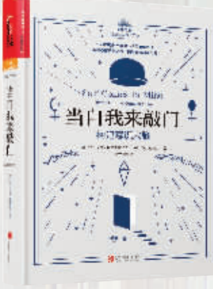
作者:安东尼奥·达马西奥 出版社:北京联合出版公司 内容简介: 达马西奥通过对多年认知神经科学研究的总结,向一个困扰人类的根本谜题发起了大胆的冲击。这个谜题就是:意识从哪里来?在梳理了大量临床案例和大脑神经解剖结构的线索后,达马西奥解释了他眼中大脑如何构建心智、心智如何构建意识的原理,并着重强调了自我在构建意识大脑中的重要性。 作者简介: 安东尼奥·达马西奥,美国南加州大学神经科学、心理学和哲学教授。