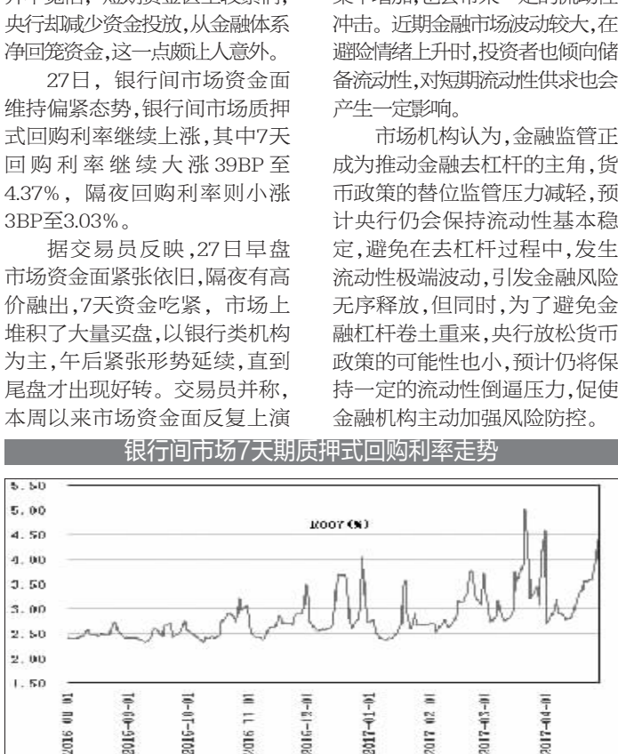
银行间市场7天期质押式回购利率走势

市场机构认为,金融监管正成为推动金融去杠杆的主角,货币政策的替代监管压力减轻,预计央行仍会保持流动性基本稳定,避免在去杠杆过程中,发生流动性极端波动,引发金融风险无序释放,但同时,为了避免金融杠杆卷土重来,发行放松货币政策的可能性也小,预计仍将保持一定的流动性倒逼压力,促使金融机构主动加强风险防控。