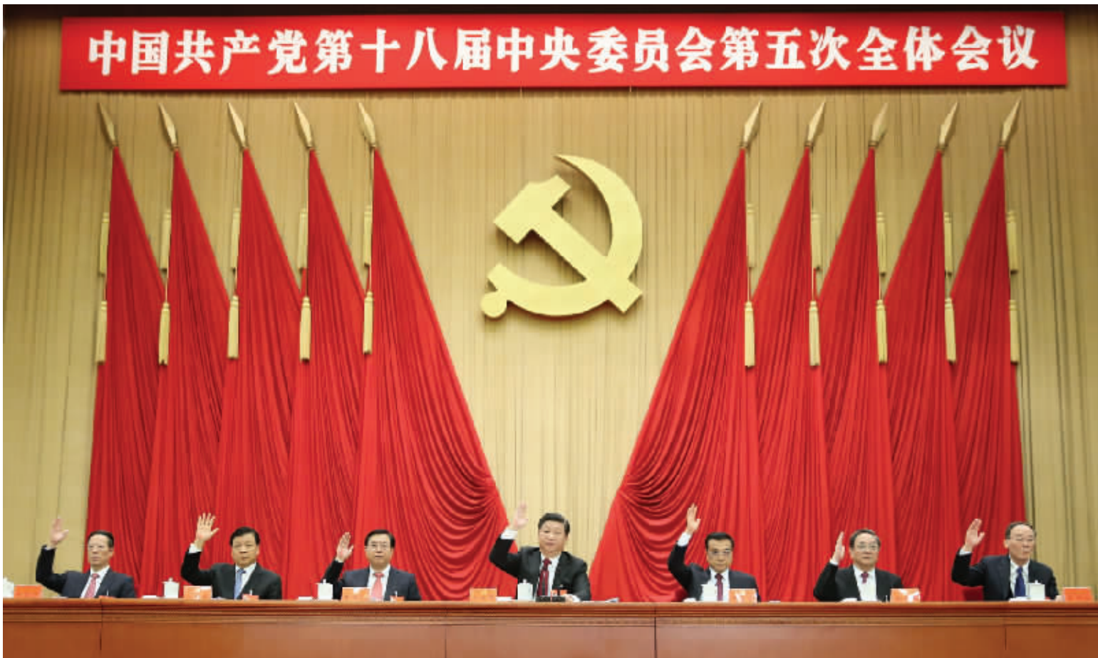
中国共产党第十八届中央委员会第五次全体会议，于2015年10月26日至29日在北京举行。这是习近平、李克强、张德江、俞正声、刘云山、王岐山、张高丽等在主席台上。

全会强调，实现“十三五”时期发展目标，破解发展难题，厚植发展优势，必须牢固树立并切实贯彻创新、协调、绿色、开放、共享的发展理念