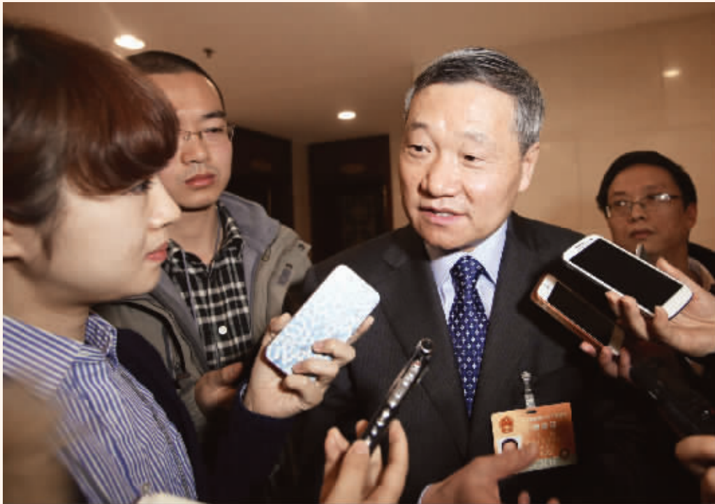
证监会主席肖钢接受记者采访。

仍比较严峻,要进一步加强稽查执法,保持对违法违规的长期高压态势,绝不手软。第一个方面,目前证监会全系统已增加稽查执法人员力量。对沪深交易所委托执法,授权从事案件调查,由证