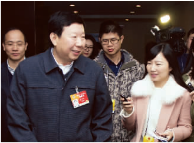
证监会副主席庄心一接受记者采访。

庄心一说,市值管理是一个全球性的一般概念,各地叫法和内涵不一样,表现形式也不一样。新“国九条”鼓励上市公司建立市值管理制度。证监会要打击的不是市值管理,而是内幕交易。市值管理有两个原则比较重要,最根本一点在于,应该在所有股东权益都同等考虑、同等维护前提下做市值管理,目的是企业的共同利益和长远利益,而不是个别股东利益。其次是市值管理不能触犯现行的法律法规中禁止和限制的领域,例如内幕交易、市场