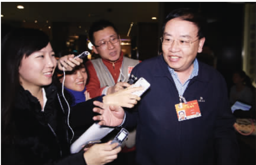
全国政协委员、上海证券交易所理事长桂敏杰接受记者采访。

桂敏杰说:“注册制落地当然越快越好,要解决的问题就是法律依据。目前,证券法规定的证券公开发行制度为核准制,而要改革为注册制,就必须先修订证券法相关条款。两会后证券法修订草案会提交人大审议,预计今年内应