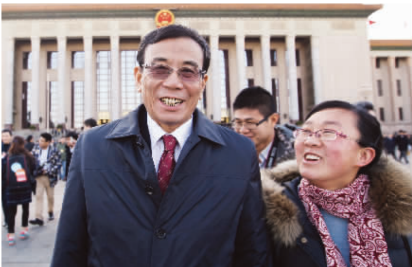
全国政协委员、深圳证券交易所前理事长陈东征接受本报记者采访。

陈东征认为,中国多层次资本市场的最主要任务就是要全力支持实体经济发展,特别是中小微企业的发展。所以,今年他的两会提案依然和去年一样,其中之一是建议在“十三五”规划中把大力发展中小企业提升为国家战略,另一个提案是加快城商行、农商行上市。“80%左右的企业得不到银行的支持,城商行、农商行在中小企业融资中的作用远远大于国有大型银行。”陈东征说。