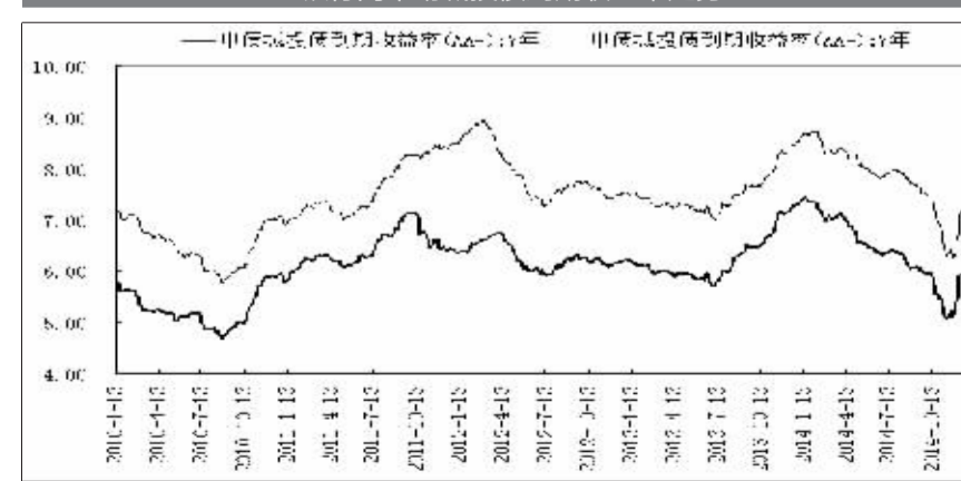
银行间市场城投债到期收益率走势

府的一系列支持,例如政府补贴、BT协议的签署等。此外,企业债募集资金都有相应的具体项目支持。一些城投债发行人拥有当地垄断行业的运营,如自来水、煤气、燃气等经营自身就会产生收益。此前市场对城投债的风险评估都是按照这一套体系分析的。然而,去年市场对城投债信用分析体系发生了改变,尤其是43号文出台后,市场对城投债的风险评估只看重“是否纳入地方政府债务”,这种粗放的分析模式只会导致城投债行情的剧烈波动——当乐观认为纳入地方政府债务时,城投债利率急剧下降;当认为难以纳入地方政府债务时,城投债利率急剧上升。但这种粗放的分析模式不会长期存在,市场终究要回归理性的信用分析体系中。