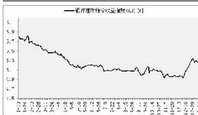
金牛银行理财综合收益指数走势

注:2015年1月13日金牛银行理财综合收益指数(A0)为5.25%,较修正后的上期数据上行1BP。数据来源:金牛理财网