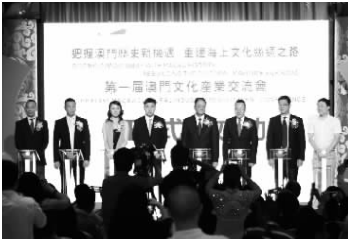
第一届澳门新濠江文化产业交流会揭牌仪式

文化资本在当今经济体系中应作为先行资本。对文化资本的传统认识是社会物质满足在前,精神需求在后,当人们进入精神层面需求后,文化资本才能发挥它固有的价值,导致社会有形资本,轻文化资本。这个观点已不适用于当今中国的经济体系,应明确文化资本不是滞后资本而是社会经济发展的先行资本。成因是:1、文化的传播力在信息传播技术高速发展的推动下已被无穷放大。如一种产品的影响力会由其文化内涵决定,以往产品在技术、质量等方面的差异化竞争优势,已被文化资本优势颠覆;2、文化的驱动力已被社会广为认可和接受。如一个社会或一个地区希望集聚各类产业资本,首先需厘清文化资本先行,没有良好的人文居住环境,人才留不住,产业要素及资本也都留不住。