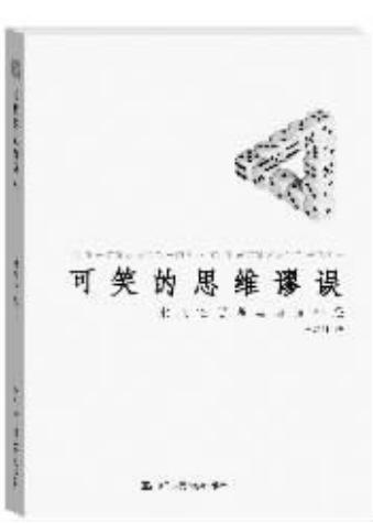
作者：冀剑制 出版社：中国人民大学出版社 内容简介：

上天赋予人们强大的思考与逻辑推理能力，人类借此创立了许多傲人的思想和不可思议的理论。然而，这些思想通常必须在历经千锤百炼之后才能开始发光发热。大多数时候，当人们处于自由自在、自然而然的思考状态时，会