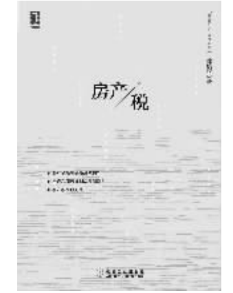
作者：徐滇庆 出版社：机械工业出版社 内容简介：

《不靠谱的伪心理学：破解心理吃语的迷思》还值得重视的迷思批评还有：对“让目标为成功加油”的批评，人并不善于准确预知自己希望得到的价值，对于风险和不确定性的把握同样很少，较早确立目标更有可能导致提前缩小注意范围，遗漏其他选择，陷入狭小视角；指出“拥抱内心的孩子”等流行励志语的荒谬意义，动辄提出“内心的孩子”甚至就以孩子自居的人，期望别人将自己看成孩子，却并不按照孩子的单纯、纯真行事，而是希望获得未成年人的免责特权，借此肆意表现出自私、粗暴、野蛮、任性、爱惹事等行为。