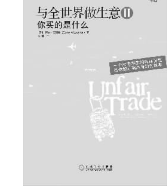
出版社：机械工业出版社 作者：(爱)柯纳·伍德曼 书名：《与全世界做生意Ⅱ》

如果说柯纳第一本书《与全世界做生意》的经历让你觉得大胆、新奇和精彩，那么，在《与全世界做生意Ⅱ》中你能感受到更多的是酸涩和不平。这本书与第一本书有很大不同，这本书并没有像第一本书那样从头到尾精彩