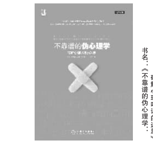
出版社：机械工业出版社 作者：(美)史蒂芬·布莱尔思 书名：《不靠谱的伪心理学：破解心理吃语的迷思》

这些所谓的法则，相当流行，看上去都很有道理，但因为太过简单而变得无法应用，许多法则与别的法则还会出现矛盾。轻信这些法则，会导致人忽略情绪、智力、记忆力等多重因素的复杂性，还会让人轻视潜在的复杂境遇和生活挑战，以为一切皆可掌握。生物学家托马斯·赫胥黎曾表示，“人类心智最深的恶，是盲信而不求证”。