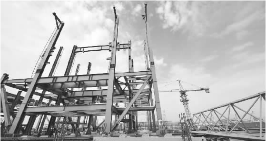
上半年宁东基地(北部)工业企业实现主营业务收入237.66亿元,同比增长22.6%,完成全口径一般预算收入27亿元,同比增长23.85%。图为宁东能源化工基地一角。

分析认为,在宁东基地渐已形成的四大产业格局中,煤化工无疑是最大亮点。但从目前来看,国家严格限制传统煤化工发展,基地着力打造的新型煤化工产业也处于起步阶段,如果未来几年不打通技术和耗水量两大瓶颈因素,那基地所拟定的新型煤化工亮点或难凸显。