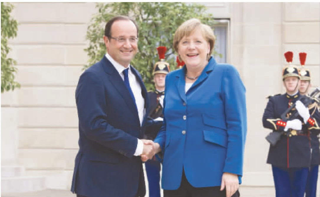
法国总统奥朗德(左)在巴黎爱丽舍宫欢迎来访的德国总理默克尔。