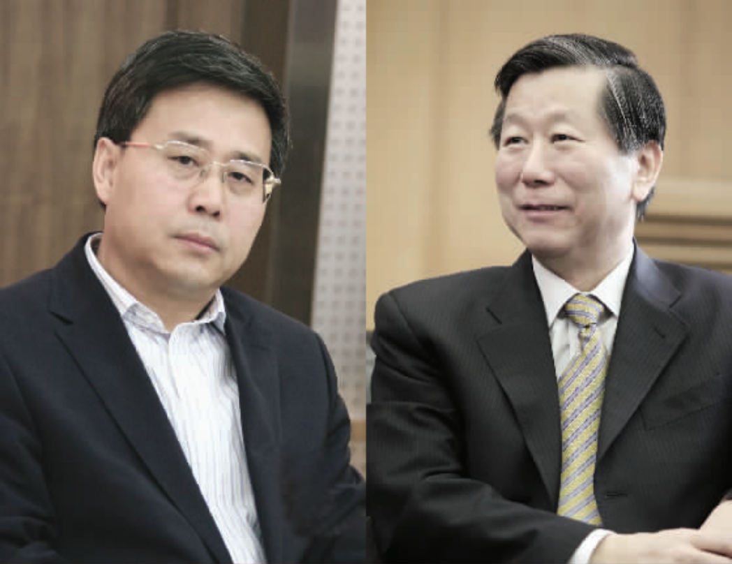
郭树清接替尚福林出任证监会主席

此前,尚福林从2002年12月开始任中国证监会主席;郭树清从2005年3月开始任中国建设银行董事长;项俊波2007年6月、2009年2月分别开始任中国农业银行行长、董事长;刘明康从2003年4月开始任中国银监会主席;吴定富从2002年10月开始任中国保监会主席。(下转A02版)